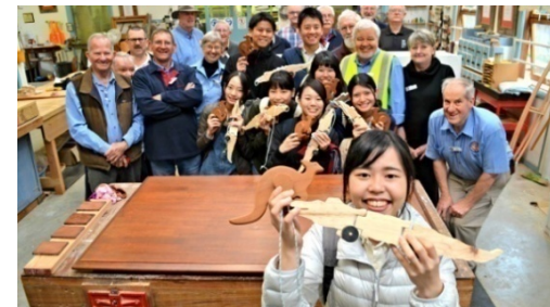
オーストラリアのベリーメンズシード訪問の様子