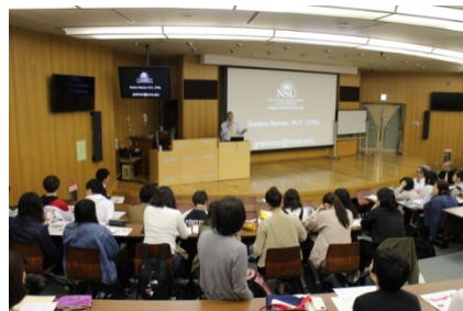
ノバサウスイースタン大学の講師による講義

世界の作業療法をリードする アメリカ 、 カナダ の研究者と交流し、来日の際には最新の研究結果に基づく特別講義を開催しています。2017年4月には、米国のノバサウスイースタン大学から2名の講師を招いて、作業科学や発達障害児の感覚特性に関する講義を受け、ディスカッションを行いました。2016年には、6名の学生が オーストラリア のベリーメンズシードを訪れ、高齢者のものづくりを通じた健康活動の取り組みを学びました。また、1年次生が授業の一環で スコットランド のクイーン・マーガレット大学の学生とメールを交換し、文化が作業に与える影響について考察しました。